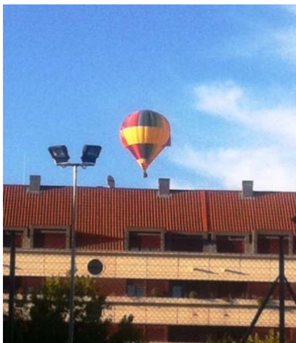
Uno de los globos sobrevuela los edificios de Valladolid