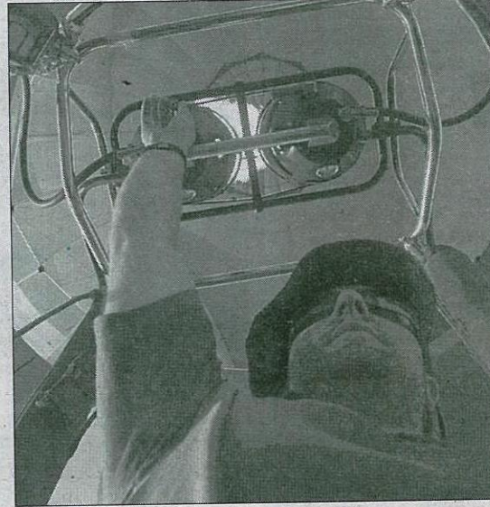
Uno de los pilotos en el momento del despegue.