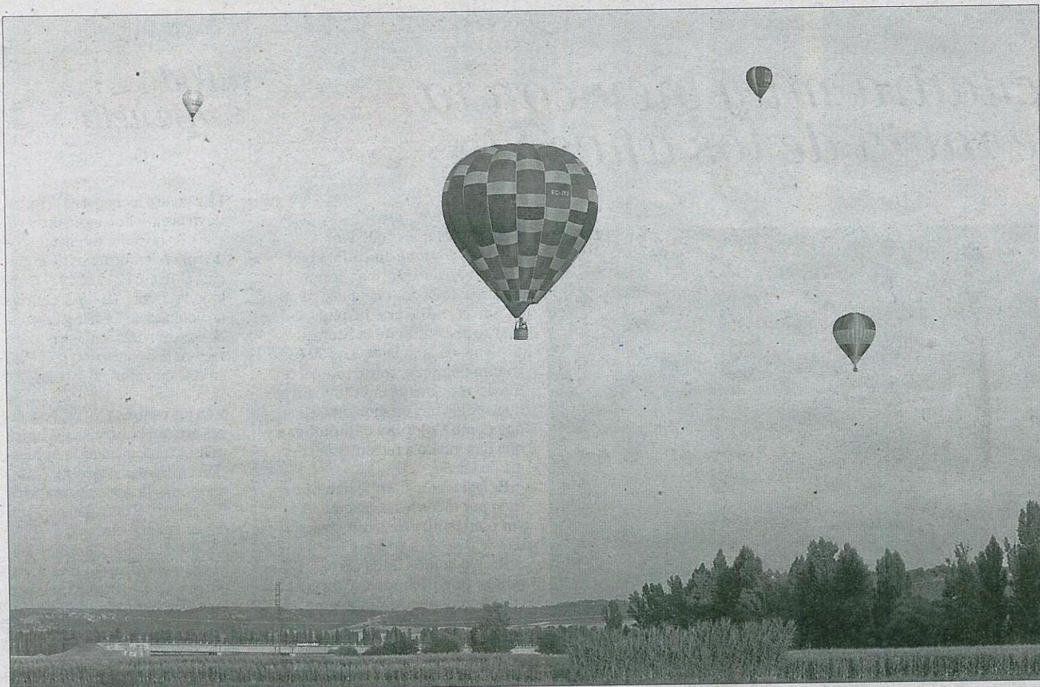
Varios de los participantes en el desarrollo de una de las pruebas del trofeo.