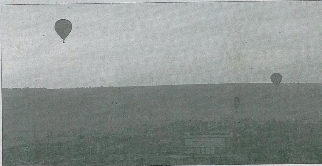
Varios globos surcaron el cielo de la ciudad en VII Open de Valladolid. Trofeo Diego Criado del Rey.

Este evento deportivo es uno de los más destacados de la ciudad en los últimos años en las Ferias y Fiestas de la Virgen de San Lorenzo y cada vez tiene una mejor acogida entre el público, por lo que el número de espectadores que se acercan a la explanada de la carretera del Cabildo es mayor cada edición.