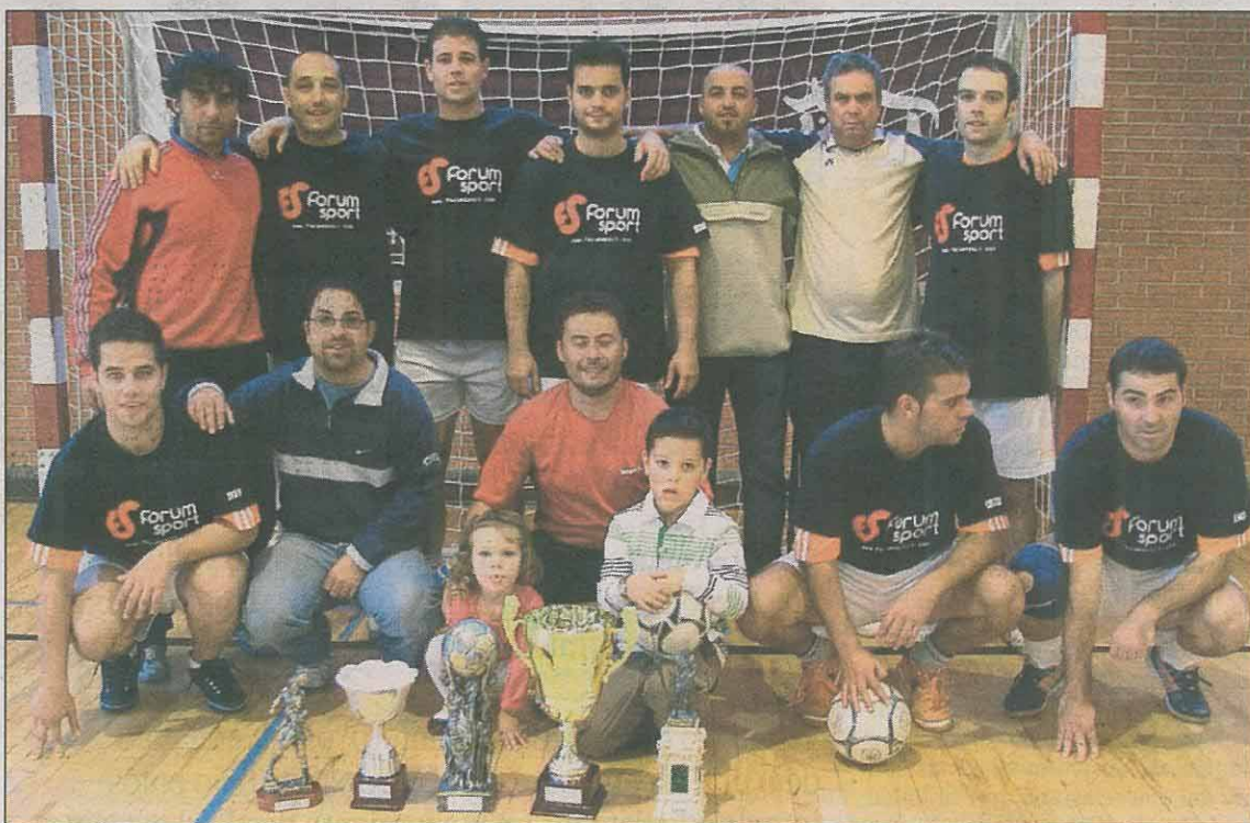
Plantilla de La Glorieta, equipo ganador de la XXVI edición del Trofeo de fútbol sala Virgen de San Lorenzo. / D.V.