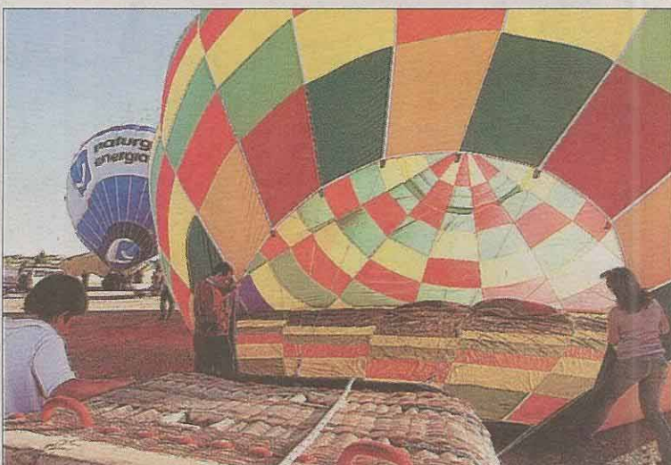
El camino del Cabildo fue el lugar elegido para el despegue.