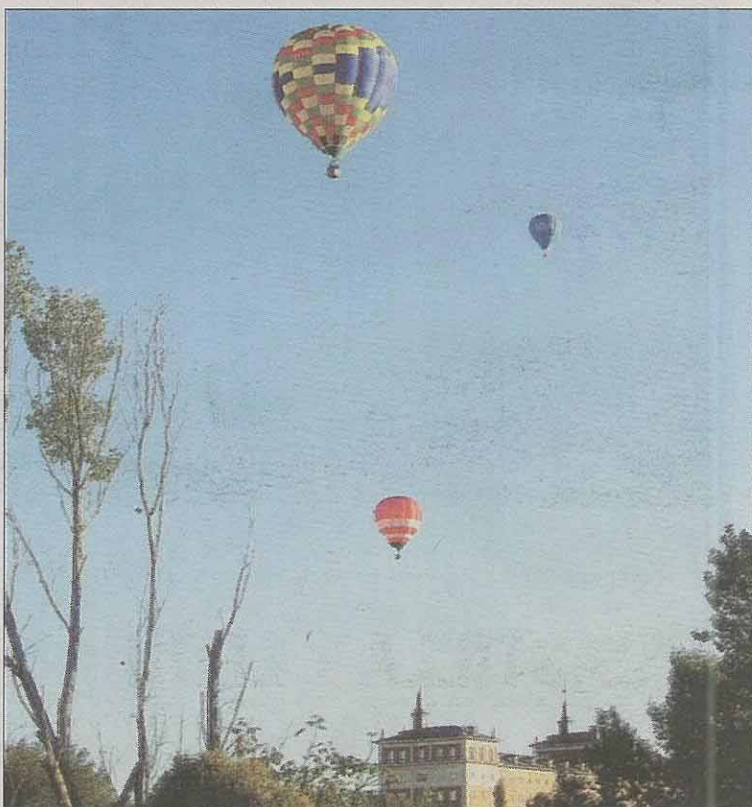
Catorce globos surcaron ayer el cielo de Valladolid.