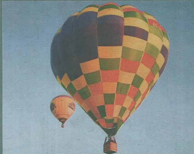
GLOBOS AEROSTÁTICOS. Participantes en el certamen Diego Criado del Rey.