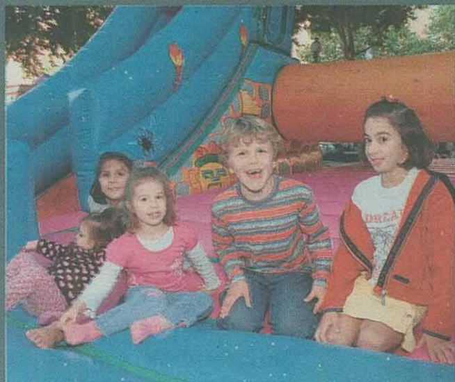
JUEGOS INFANTILES. Hinchables en las instalaciones de El Corte Inglés del Paseo de Zorrilla.