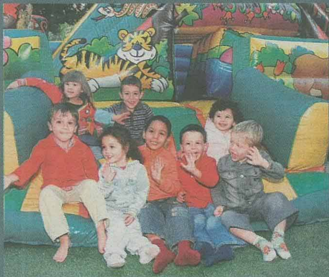
HINCHABLES. Un grupo de niños disfruta del parque 'Vuelta al cole'.